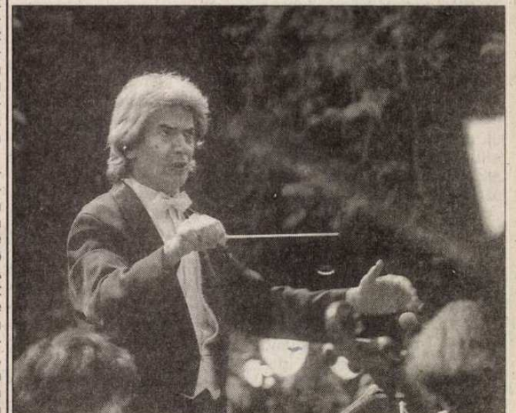
Medveczky Ádám a Magyar Szimfonikus Zenekar élén