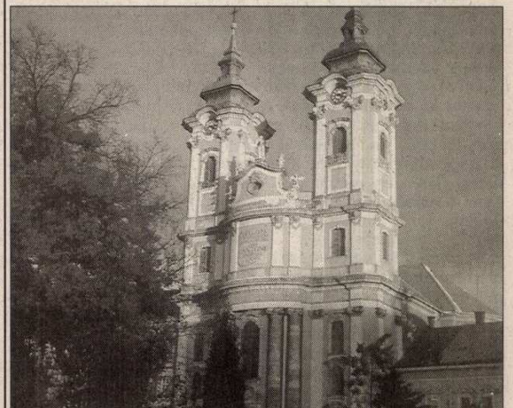
Egerben jártunk (4. oldal)