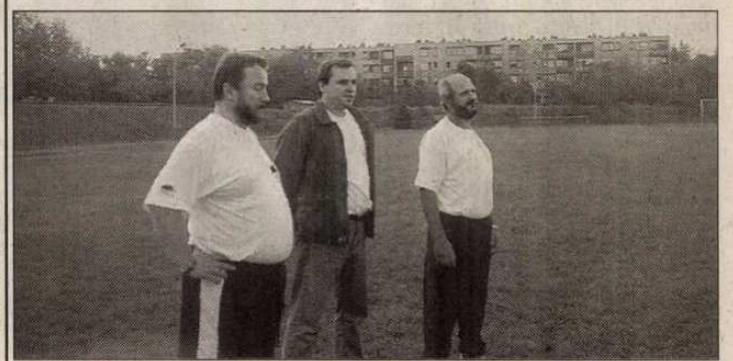
Verseny a Hírker Kupáért (2. oldal)