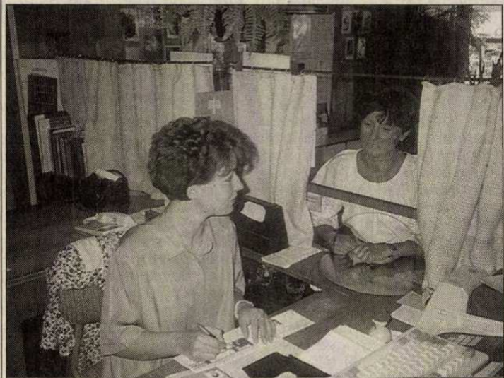
Az ajkai postán

dott meg. Területünkön 450, Ajkán 250 ilyen volt.