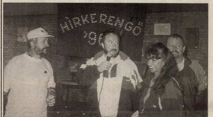
Csak a forralt bor hiányzott (2. oldal)

A rendkívül gazdag és változatos anyag egyben tisztelgés a 125 éves magyar bélyegkiadás előtt is.